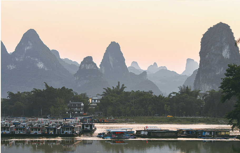
这是在广西桂林市阳朔县兴坪镇拍摄的山水风光。