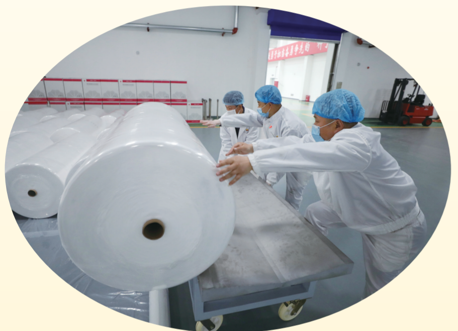
在中国石油辽阳石化公司聚酯厂车间,工人运送刚生产完的熔喷无纺布。