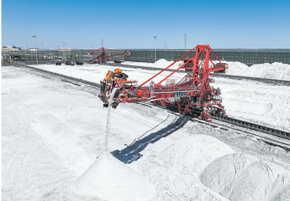
青海盐湖股份斗轮机。

明轻点鼠标控制着采盐船,以每分钟6米的速度在厚厚的盐矿层上行驶。同时,平均1.5米深的湖水之下,采盐船巨大的切割头借力内部螺旋设备将盐矿搅拌成矿浆,再通过输卤管将滴卤水输送到生产车间。