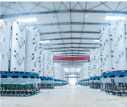
碳酸锂四万吨项目场内建设中。