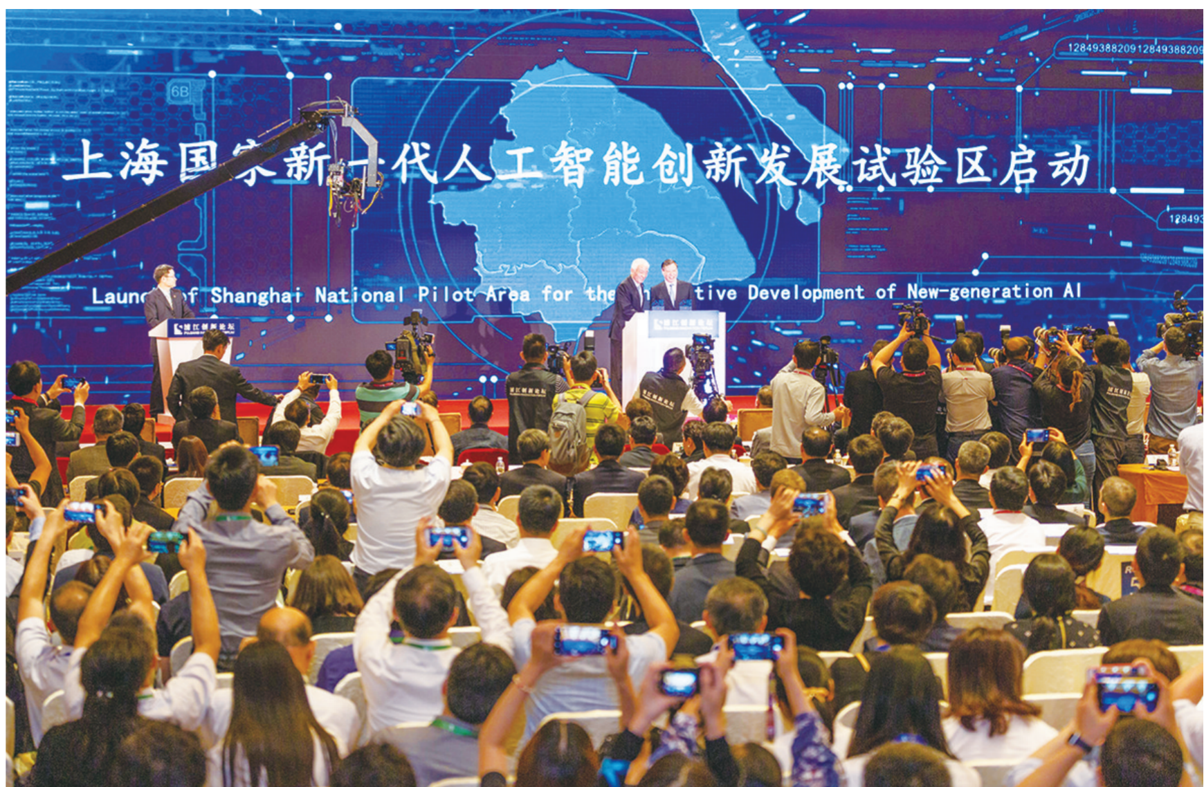
在上海举行的2019浦江创新论坛全体大会上,科技部与上海市政府共同启动上海国家新一代人工智能创新发展试验区建设(2019年5月25日摄)。

以近期备受瞩目的生成式人工智能为例,百度、科大讯飞等公司纷纷加快布局。“以前人工智能只能做一件事,由于大数据、大算力、大模型的出现,机器有了融会贯通的能力,应用场景一下子打开。”百度首席执行官李彦宏说。