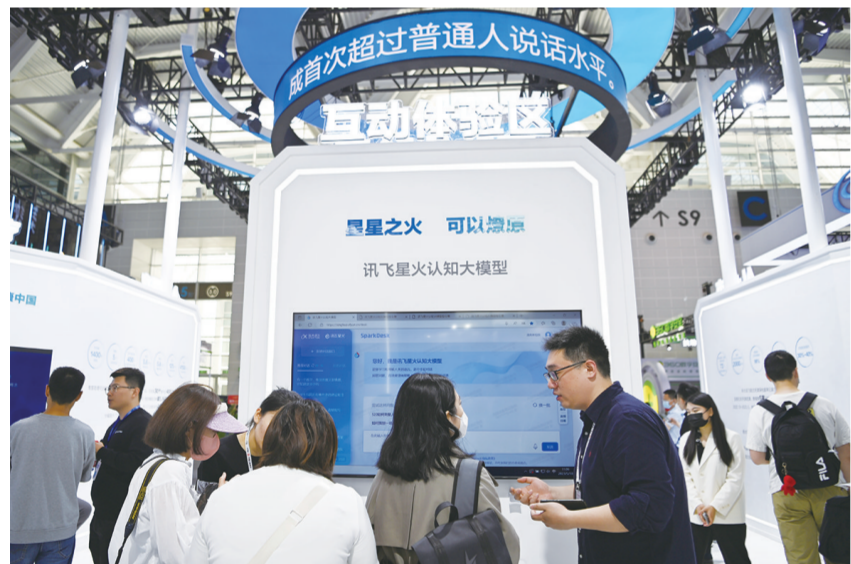
5月18日,观众在第七届世界智能大会智能科技展上参观科大讯飞展区。

万钢表示,新一代人工智能应以应用市场拓展和产业生态培育为主攻方向,依托我国超大规模市场的优势,吸引全球的创新资源和我国实体经济深度融合,不断打造产业发展的新态势,成为新经济社会发展的新引擎。