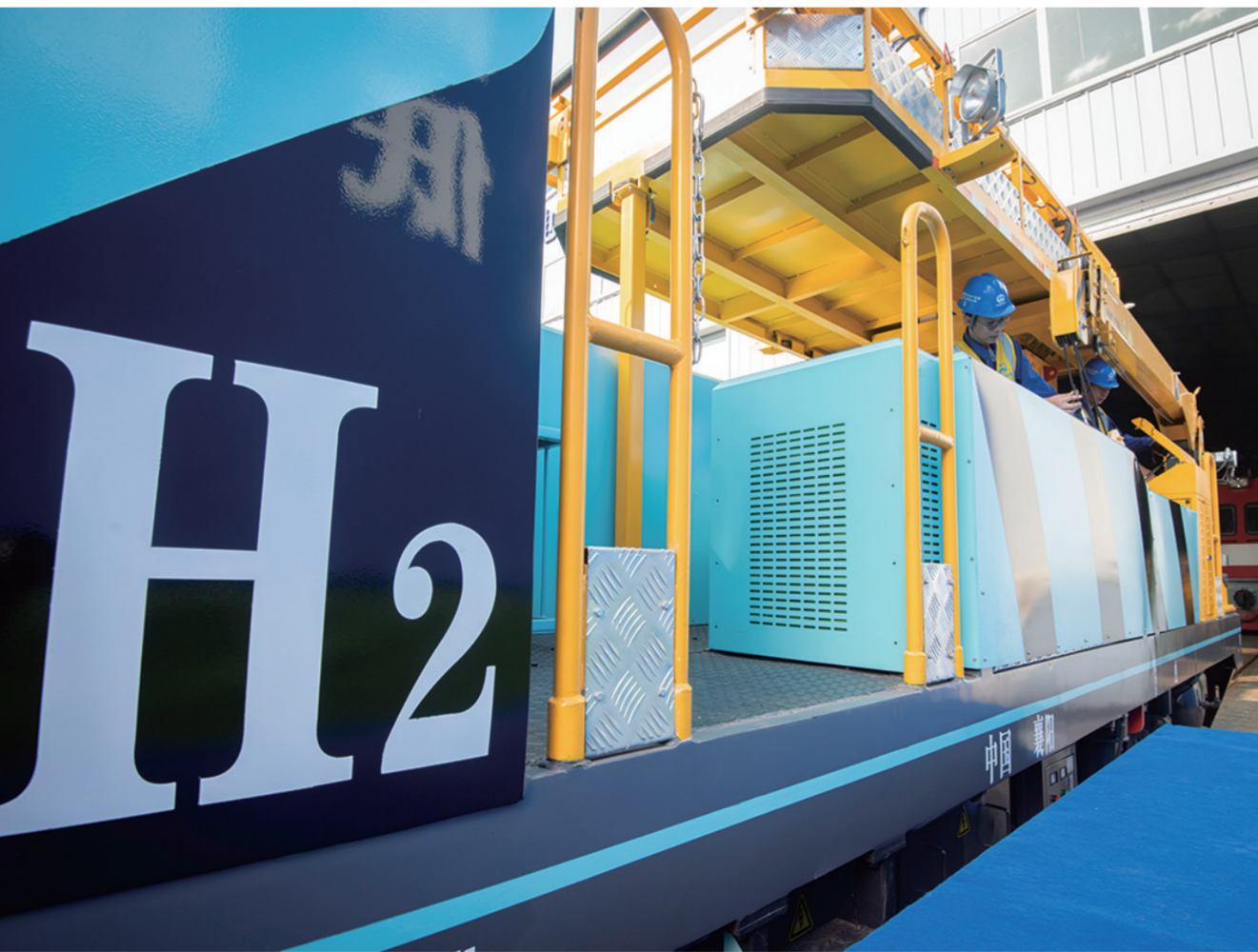
7月18日拍摄的由中铁武汉电气化局研制的氢能源地铁施工作业车。据了解，该作业车采用氢燃料电池与锂电池混合动力系统提供牵引动力，运行时没有废气和噪音，排放物为水，能应用于地铁、隧道、矿山等相对密闭的环境。