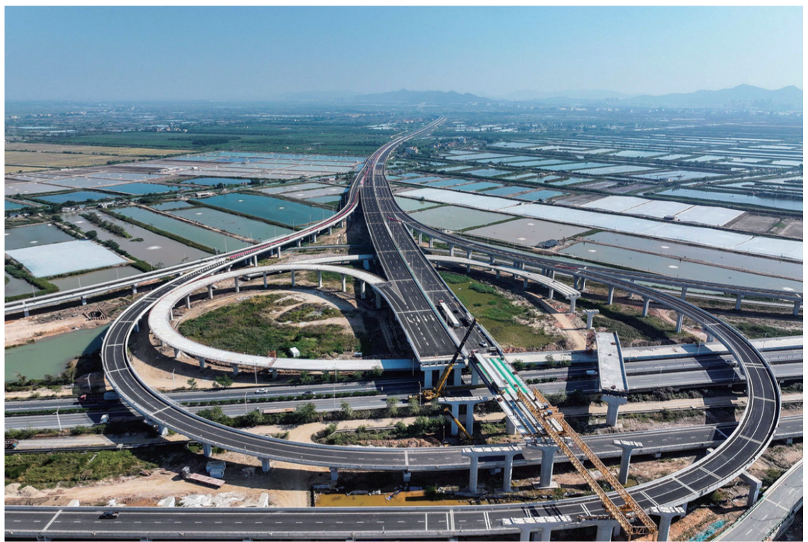
12月8日拍摄的广东鹤港高速高栏港枢纽(无人机照片)。全长34.5公里的鹤港高速连珠港澳大桥西延线，西接黄茅海跨海通道，共同组成粤港澳大湾区基础设施“硬联通”交通主干线之一。