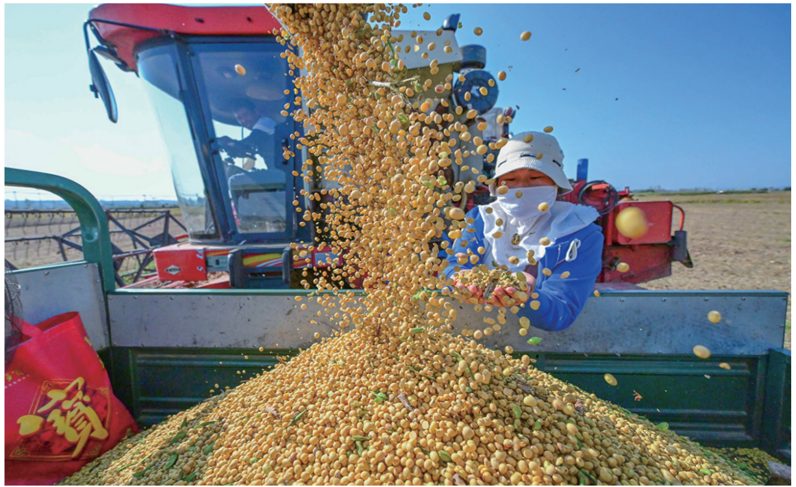
10月14日，在河南省洛阳市孟津区会盟镇黄河岸边的下古村，农民收获大豆。今年，我国继续提高小麦、稻谷最低收购价，完善玉米大豆生产者补贴，增加产粮大县奖励资金规模，扩大三大粮食作物完全成本保险和种植收入保险实施范围。