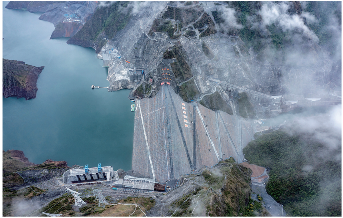
6月22日拍摄的四川雅砻江两河口水电站(无人机照片)。我国第三大水电基地雅砻江流域清洁能源基地是国家规划的大型水风光一体化示范基地，基地装机总规模超1亿千瓦。

2023年，面对波谲云诡的国际政治经济环境和繁重艰巨的国内改革发展稳定任务，中国经济在爬坡过坎中前行，在攻坚克难中奋进，沿着高质量发展航道笃定向前。