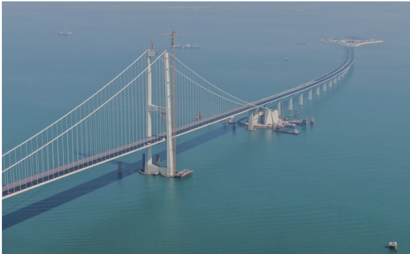
11月28日，粤港澳大湾区超级工程深中通道主线正式贯通，这是深中通道伶仃洋大桥东塔及西人工岛(无人机照片)。