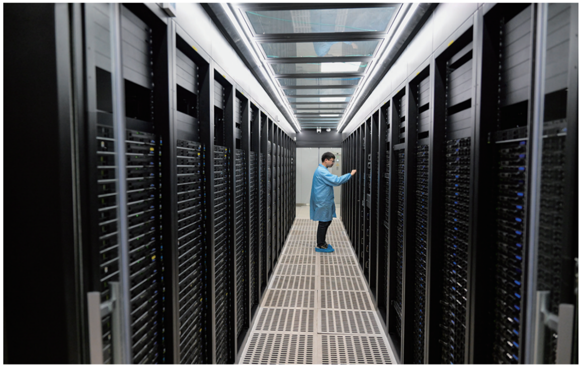
11月28日，工作人员在内蒙古中科超算科技有限公司对设备进行巡检。近年来，内蒙古自治区呼和浩特市和林格尔新区发挥资源和区位优势，大力培育以大数据、云计算为特色的电子信息技术产业集群，构建数字经济发展新格局。