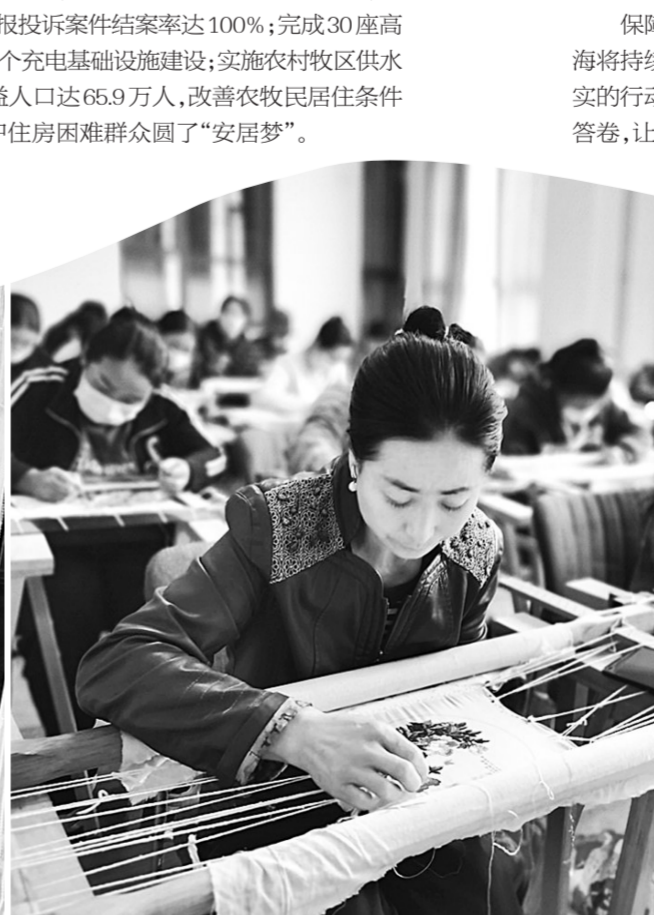
拓宽增收致富渠道。