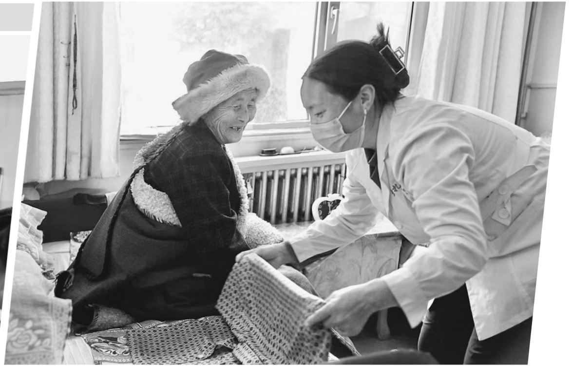
全力守护“一老一小”的幸福。