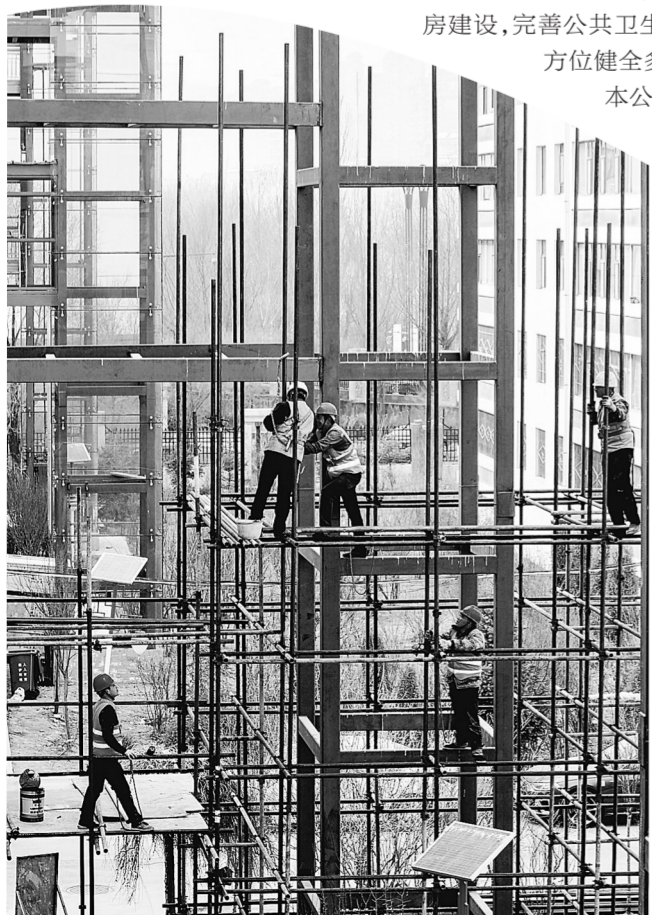
政府补贴老旧小区加装电梯。

保障和改善民生没有终点，只有连续不断的新起点。未来，青海将持续坚持以人民为中心的发展思想，聚焦群众所需所盼，以踏实的行动、务实的举措，在新时代赶考之路上交出百姓满意的民生答卷，让现代化新青海建设成果更多更公平惠及全省各族人民。