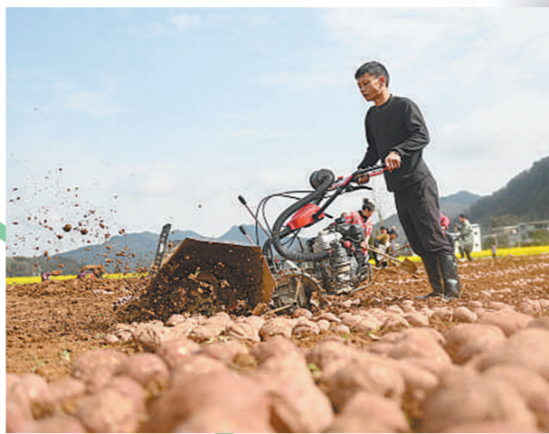
贵州省铜仁市松桃苗族自治县孟溪镇寨阳村,农民在整地培育红薯苗。