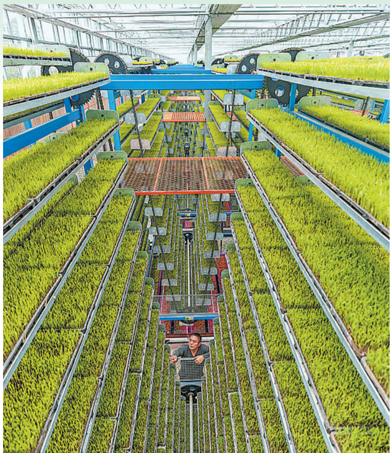
重庆市永川区仙龙镇双星村的智能育秧基地内,秧苗在水肥一体化系统的精心照料下长势喜人。