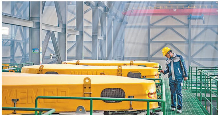
▲青海盐湖工业股份有限公司钾肥分公司加工车间内,工人在巡检钾肥生产状况。