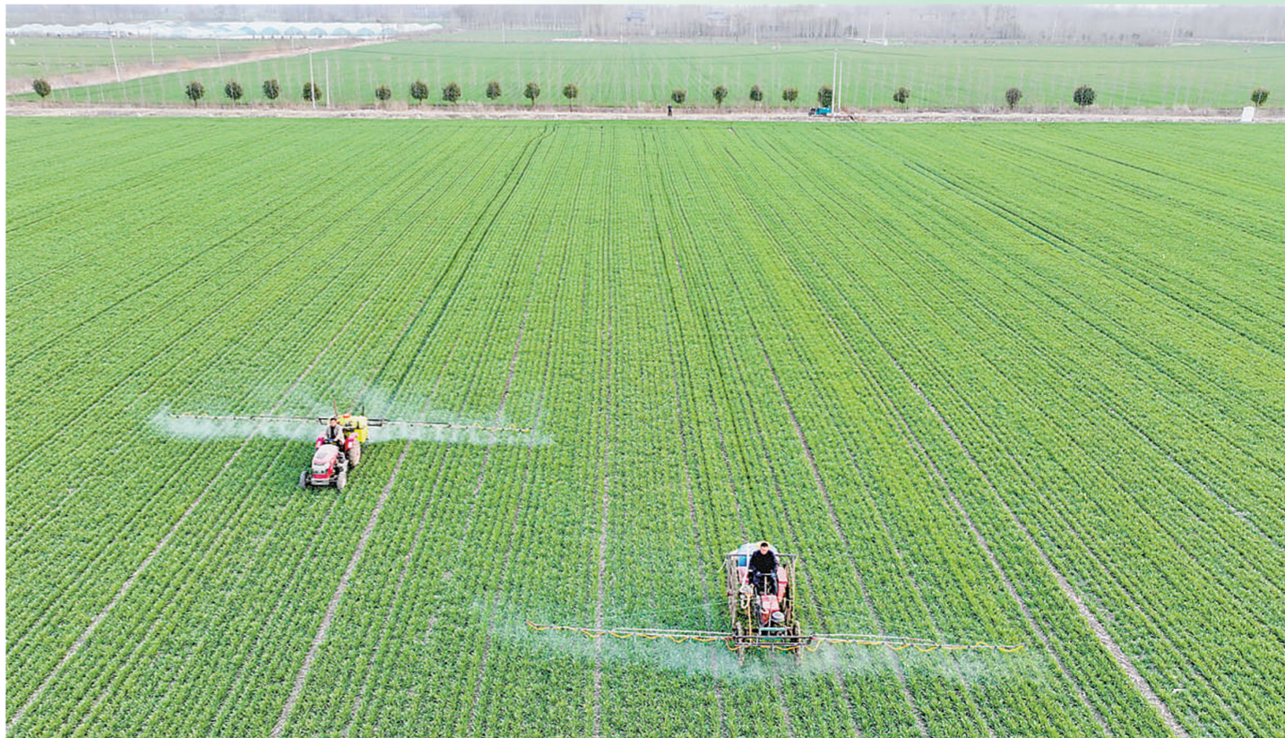
▼安徽省亳州市谯城区双沟镇三官村方向家庭农场,农民驾驶植保农机对小麦进行喷洒除草作业。刘勤利摄(人民视觉)