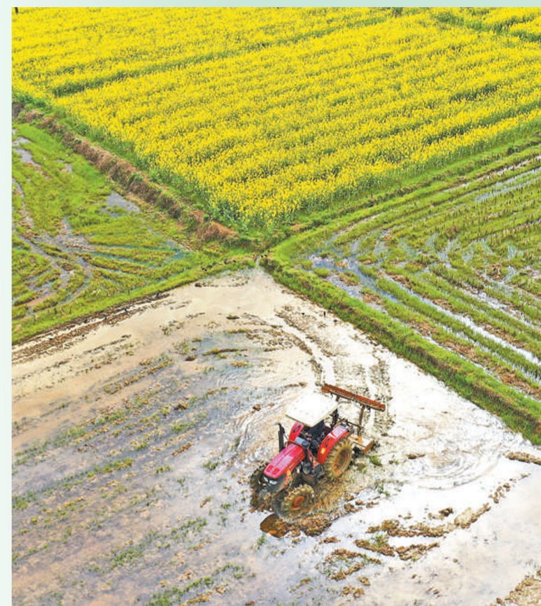
湖南省衡阳市衡东县白莲镇,当地村民驾驶农机在翻耕稻田。