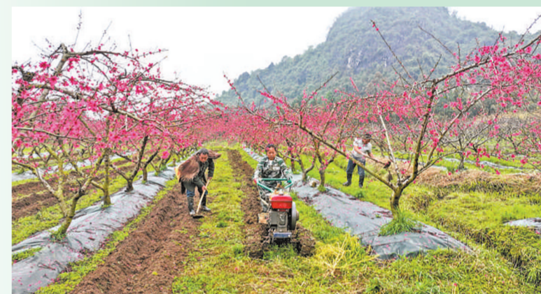
广西壮族自治区桂林市灵川县海洋乡天桃种植基地,村民在桃园间开沟施肥。