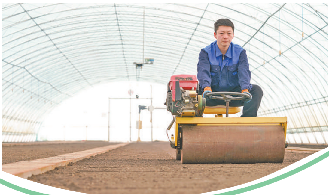
▼黑龙江北大荒农业股份有限公司友谊分公司智慧农场育秧大棚里,职工在进行水稻育秧前的地面平整作业。