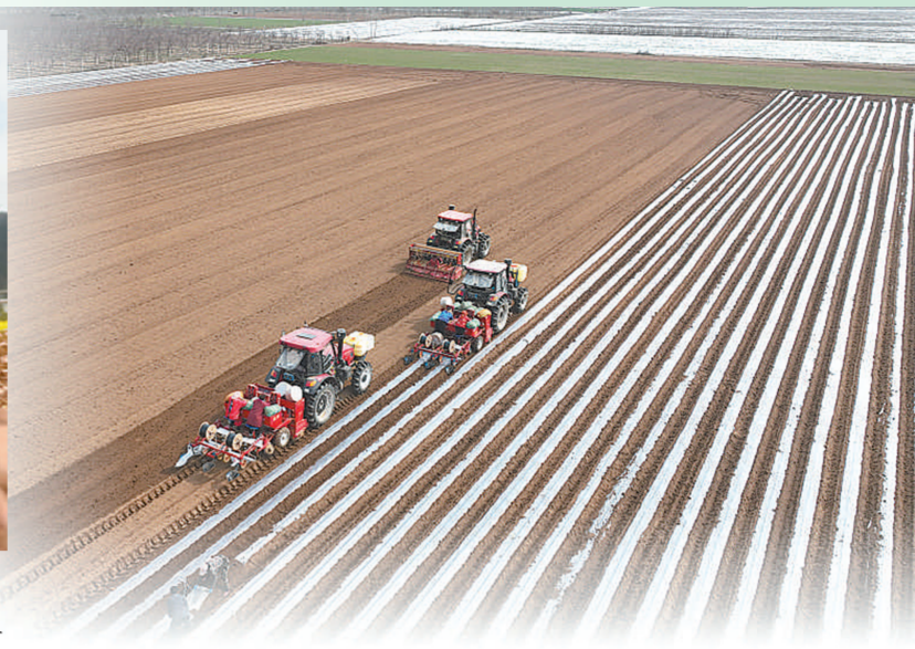
山东省临沂市郯城县马头镇圩西村蔬菜种植基地,农机手驾驶播种机在播种“订单土豆”。