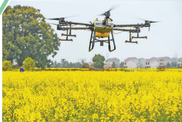
▲江西省樟树市,农民和农业合作社抢抓农时,开展植保无人机“飞防”作业等农事活动。