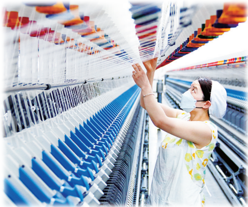
2024年3月12日，在山东腾峰纺织科技有限公司，工作人员在智能化纺纱设备前忙碌。山东省五莲县聚焦产业绿色转型，实施工业倍增“突破工程”，围绕新旧动能转换推动传统工业转型升级。与此同时，不断培育新兴产业，聚焦新一代信息技术、高端装备、新材料等，着力构建现代化产业体系，助推县域经济高质量发展。

拥抱中国绿色转型带来的业务机会，这家来自丹麦的跨国巨头不断加大在创新和智能制造等领域的投入。“中国正在推进高水平对外开放，重申了改善营商环境的承诺，尤其是中国政府对知识产权保护的重视，让我们坚定信心，持续投资中国。”方行健说。