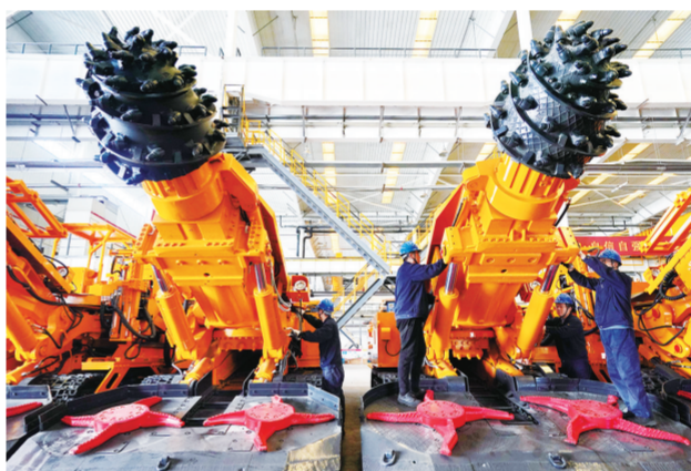
2024年3月19日，石家庄煤矿机械有限责任公司工人在检修产品。近年来，河北省石家庄市栾城区围绕装备制造转型升级发展需要，以智能制造为主要方向，深入实施创新驱动发展战略，推动一批装备制造企业加快智能化改造和数字化转型升级步伐。

“中国在我们全球投资战略中具有极为重要的地位。”沙特阿拉伯国家石油公司(沙特阿美公司)总裁兼首席执行官阿明·纳赛尔表示，中国着力发展战略性新兴产业、未来产业，这将在石油化工、先进复合材料和非金属材料、碳减排技术、低碳能源、数字技术等领域，为双方合作带来新机遇。