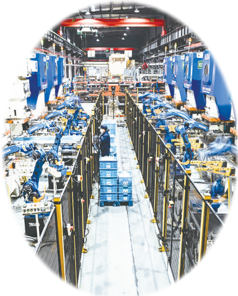
在“江苏省专精特新中小企业”无锡微研精工科技有限公司智能生产车间，机械臂在作业(2024年2月28日摄)。