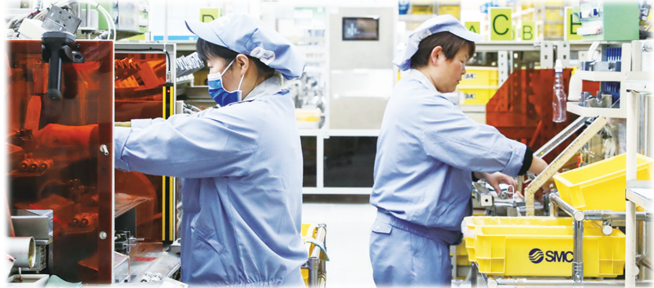
2024年2月28日，工人在位于北京市大兴区的SMC(中国)有限公司北京第二工厂工作。