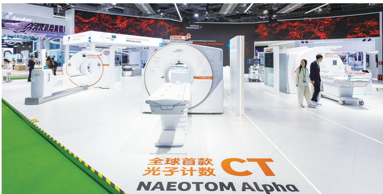
2023年11月8日在第六届中国国际进口博览会医疗器械及医药保健展区拍摄的西门子展位。