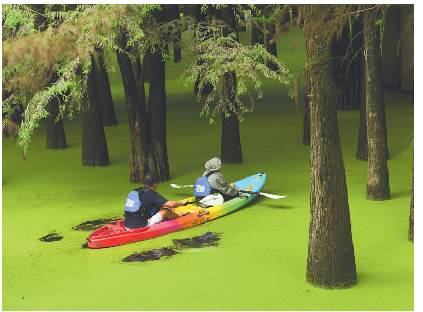
9月4日,游客在水上森林泛舟。 初秋时节,杭州青山湖水上森林近百亩池杉、落羽杉和水面的浮萍相映成趣,呈现出幽静的生态景观。