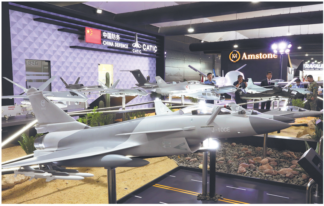
这是9月3日在埃及阿拉曼举行的埃及首届国际航展上拍摄的中航技进出口有限责任公司展台。 当日,埃及首届国际航展在地中海南岸的埃及滨海城市阿拉曼国际机场拉开帷幕。

据儿基会消息,新冠疫情暴发前,朝鲜全国免疫接种率超过96%,但疫情期间接种率大幅下降,很多儿童面临脊髓灰质炎、白喉、麻疹、风疹等致命疾病的威胁。儿基会曾在2021年至2023年间为朝鲜的三次补种疫苗接种活动提供支持。朝鲜此次疫苗接种活动已于2日启动。