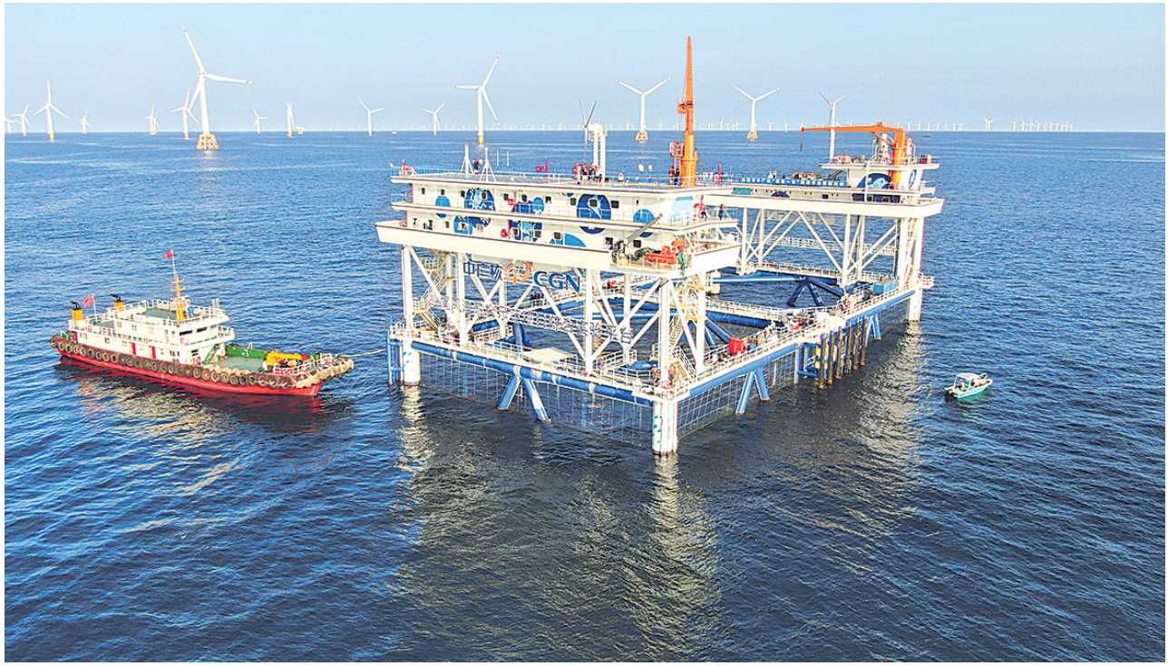
这是9月2日拍摄的中广核“伏羲一号”风渔融合网箱平台(无人机照片)。 9月4日,超大型风渔融合网箱平台——中广核“伏羲一号”正式在广东汕尾建成投运。“伏羲一号”位于汕尾中广核后湖50万千瓦海上风电场中心场区,距离汕尾海岸约11公里,由网箱主体结构和上建平台两部分组成。“伏羲一号”是全部依靠绿色能源供能的大型风渔融合网箱平台,配置应用了绿电供能保障、气水联合投喂、网衣自动清洗、环境监控预警、活鱼保鲜驳运等五大海洋牧场智能化系统。网箱主体结构长70米,宽35米,水深约25.7米,养殖水体达到6.3万立方米,预计年产优质海水鱼类约900吨,项目对于我国“海上风电+海洋牧场”产业融合发展具有重要示范意义。

新华社雅典9月4日电(记者 陈刚) 希腊汉学中心日前在科孚岛正式揭牌运营,将开展汉学与中国研究领域的人才培养。 希腊汉学中心由北京语言大学和希腊爱奥尼亚大学联合建设,天津古籍出版社专项基金支持。这是希腊首家由中希两国高校联合设立的汉学研究中心,中心将培养汉学和中国研究领域的学士、硕士、博士及博士后。此外,汉学中心还将开设文化遗产与安全研究硕士项目,为中国及欧盟国家文化遗产领域培养高水平人才。 爱奥尼亚大学校长安德烈亚斯·弗洛罗斯在揭牌仪式上表示,该中心的建立见证了希中两国学术合作的显著成果,彰显了希中两国迫切希望深化合作的共同愿望。 北京语言大学世界汉学中心主任、汉学与中国学院院长徐宝锋致辞时说,希腊汉学中心是促进中国与希腊、东南欧和东地中海地区在汉学和中国研究领域开展学术合作的桥梁和平台,将进一步推动希腊汉学与中国学研究深入发展,为相关学术可持续发展提供资源。 中国驻希腊大使肖军正在致辞中表示,希腊汉学中心的成立不仅是中希学术交流和人文合作的重要里程碑,更是中希两国在深化文化交流、促进文明互鉴方面迈出的坚实步伐。这一举措对加强两个伟大文明之间的相互了解和理解,推动双方在人文领域深入合作具有深远意义。