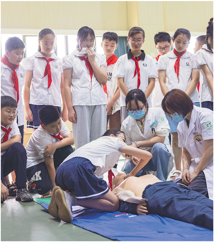
9月4日,在浙江省湖州市吴兴区龙泉小学,学生在医护人员指导下学习心肺复苏技能。 当日,浙江省湖州市吴兴区龙泉街道潘公桥社区开展“急救知识进校园”活动,组织专业医护人员向师生传授应急救护知识,提高师生们的应急救护能力。