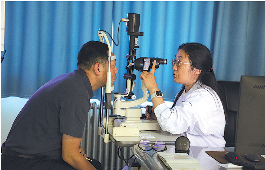
文/图 本报记者 吴婷婷 青普力

昆仑山下,巴音河畔,一批来自浙江的“白衣卫士”将先进诊疗技术和优秀管理理念带到海西州。他们用一桩桩、一件件实事践行着援青医疗专家的责任和担