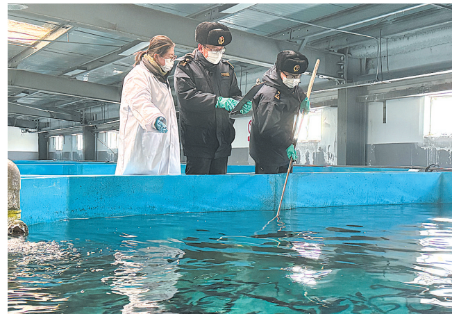
西宁海关所属西海海关关员对出口虹鳟鱼开展监管作业。