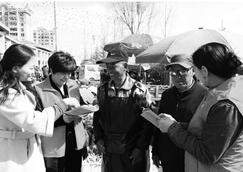
茫崖市冷湖镇:激活“枫桥经验”新动能

握辖区动态,精准摸排矛盾纠纷隐患线索。同时,建立“警调”“访调”“诉调”对接机制,实现矛盾纠纷全方位排查、全链条预警,将风险化解在萌芽状态。